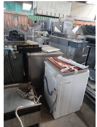
Localização - Leiria