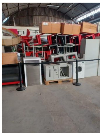
Localização - Leiria